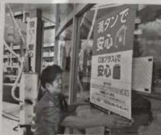
セールスルームの窓にポスターを