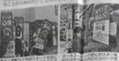
「満タン運動」の一環として、ガソリンスタンドで「満タン」のスタンプを貼る様子。