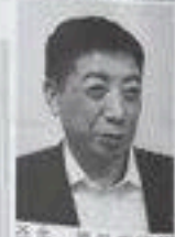
全石連 会長インタビュー